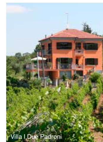
Villa I Due Padroni