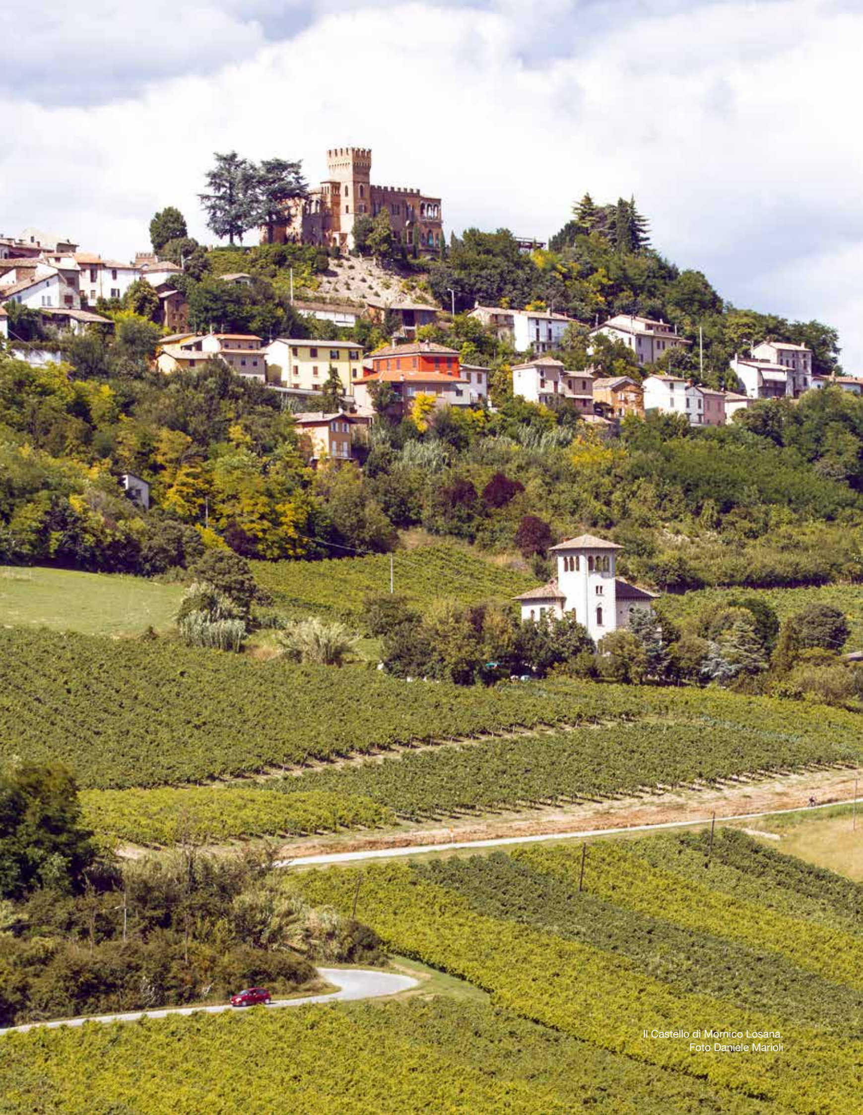
Il Castello di Mornico Losana.