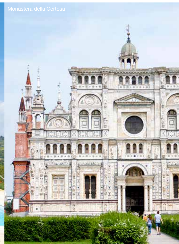
Monastero della Certosa

'Pavia, met al zijn vertier, is dichtbij en de rust hier is voor de kinderen ideaal'